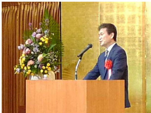
講師:キャスター 辛坊 治郎 氏

まだまだお伝え出来ない盛りだくさんの内容で1時間半はあっという間に過ぎて行きました。参加された皆様は「話のテンポもよく、流石だ」「お話のプロ! 引き込まれた」と、とても喜んでいただきました。