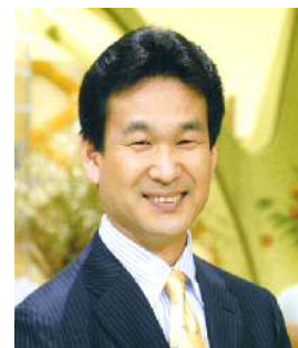
講師 辛坊治郎 氏 キャスター

*講演会、交流会とも参加費は無料です。 *組合員の皆様には後日ご案内をお届けいたします。