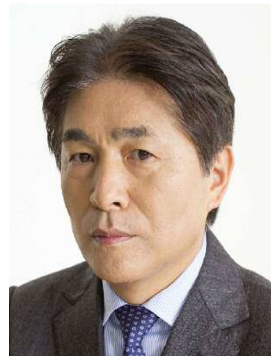
講師：NHKサッカー解説者 山本昌邦氏