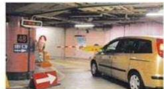
駐車場決済イメージ